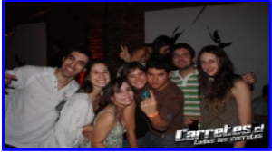
Fiesta Massivo 2.0 Galpon 9- 16/08