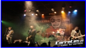
Concierto Tronic Galpon Victor Jara- 17/08