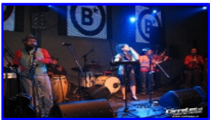
La Mano Ajena Blondie - 14/08